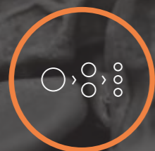
Instalacja do granulowania

Zakład Przetwarzania Złomów Metali Kolorowych w Mirosławicach współpracuje ściśle z naszą najnowszą inwestycją – Zakładem Recyklingu Złomów Alumiiniowych.