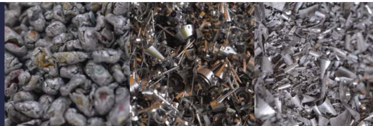
granulat aluminium do odtleniania stali w różnych frakcjach

Specjalistyczne linie do przetwarzania, separacji i granulacji metali pozwalają na uzyskanie wysokiej jakości materiału np.: